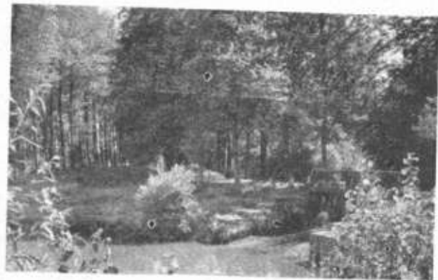
Partie am Lindenweg

Kraft- oder Radfahrer verlassen Elze auf der Bundesstraße 3 in nördlicher Richtung (Wegweiser Richtung Hannover). Etwa 2 Kilometer hinter Wülfigen biegen Sie unterhalb des Marienberges nach Osten ab (Wegweiser Richtung Nordstemmen). Fahren Sie unterhalb des Marienberges entlang bis zur Leinebrücke. Hier biegen Sie vor dieser Brücke schräg nach links ab und benutzen die Autoanfahrt zum Parkplatz des Schlosses Marienburg. Diese Anfahrt ist auch für Reisebusse befahrbar. Stellen Sie Ihren Wagen auf dem Parkplatz ab und gehen Sie das letzte Stück Weges bis zum Schloß. Fahrzeit für Kraftfahrzeuge etwa 15 Minuten. Fahrzeit für Radfahrer etwa 45 Minuten.