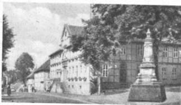
Elze, Hauptstraße mit Rathaus und Kriege denkmal 1870 • 71

STAHLWERKE Röchling - Buderus A.G. Werk Mehle