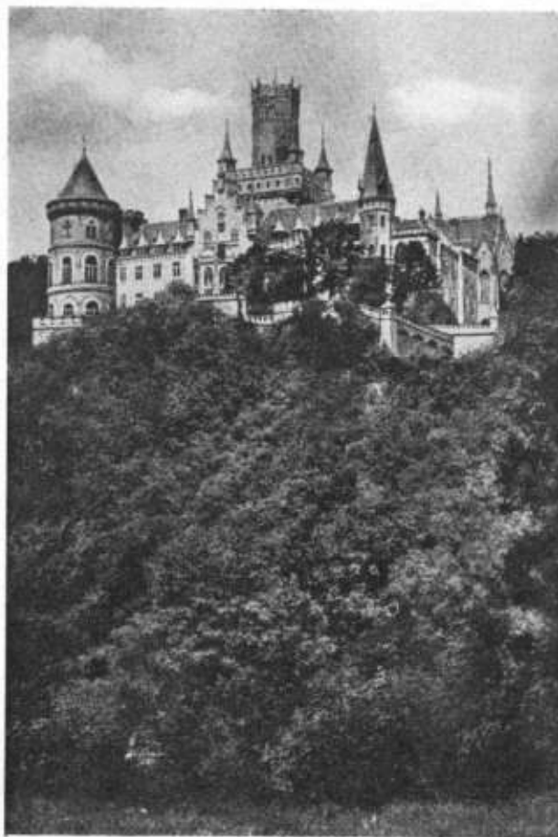
Schloß Marienburg bei Nordstemmen