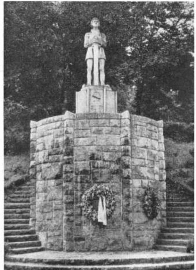
Roland-Denkmal auf dem Rolandplatz in der Bahnhofstraße.