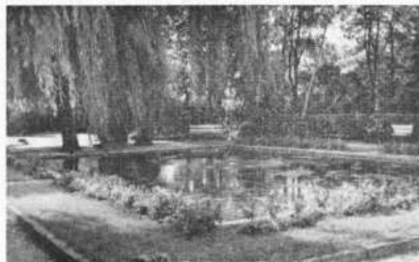
Der Stadtpark in Elze