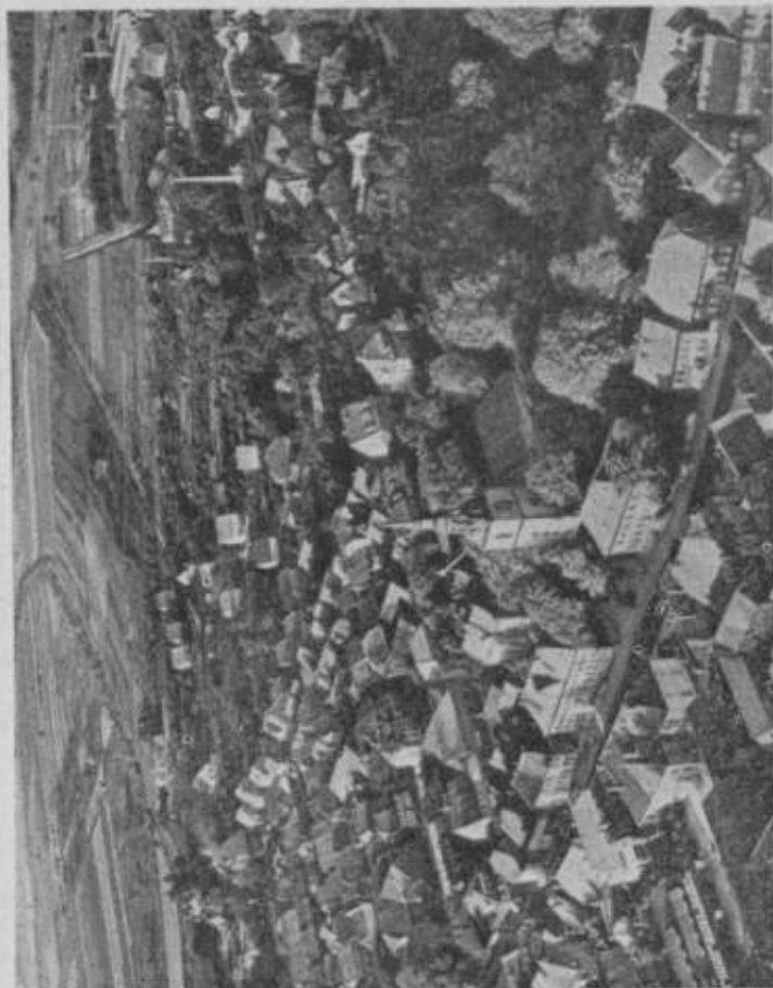
Teilansicht von Elze (Luftbild)